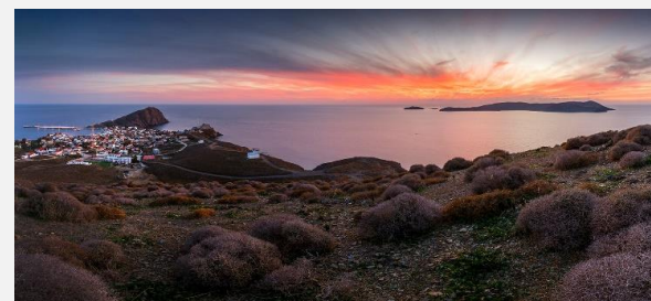
Ψαρά και στο βάθος τα Αντίψαρα