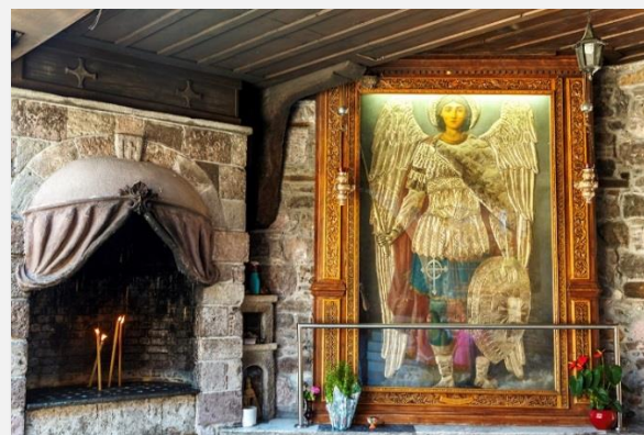
Μονή Ταξιάρχη, Μανταμάδος