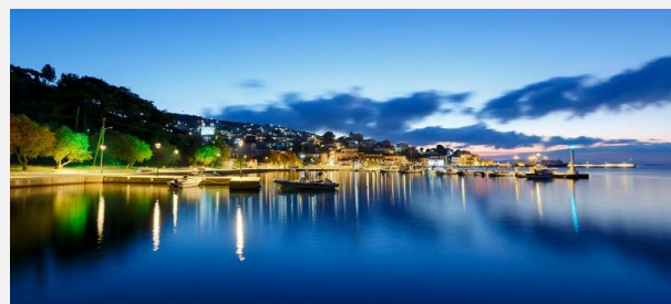
Ξημέρωμα στις Οινούσες