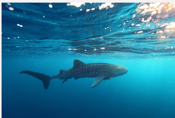
Φαλινοκαρχαρίας κολυμπάει στα κρυστάλλινα νερά των Φιλιππίνων