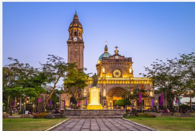
Άποψη του Καθεδρικού Ναού της πρωτεύουσας Μανίλα

Το τροπικό αέρακι και οι πρωτόγνωρες μυρωδιές δίνουν αμέσως το στίγμα ότι βρισκόμαστε στην ασιατική μεγαλούπολη. Η τελευταία μας ημέρα στις Φιλιππίνες είναι αφιερωμένη στην εξερεύνηση της μαγικής Πολυνησίας, την πρωτεύουσα Μανίλα . Από τις πρώτες κιόλας εικόνες καταλαβαίνει κανείς γιατί ονομάστηκε «μαργαριτάρι της Ανατολής» και «πετράδι της αυτοκρατορίας στον Ειρηνικό» από τους Ισπανούς, που πρώτοι πάτησαν και βέβαια «τρύγησαν» τα χώματά της. Από τον 16ο μέχρι τον 19ο αιώνα ήταν μια καλά οχυρωμένη πόλη, με μεγάλους δρόμους και βασιλικές επαύλεις. Ωστόσο μετά τον Β' Παγκόσμιο Πόλεμο η πόλη ισοπεδώθηκε και σταδιακά άρχισε η ανοικοδόμησή της, αποτελώντας σήμερα μια σύγχρονη μητρόπολη που αρχιτεκτονικά ακροβατεί μεταξύ ισπανικού, κινεζικού και μαλαισιανού στυλ με ολίγον από... Μανχάταν. Κάπου εδώ το ταξίδι μας