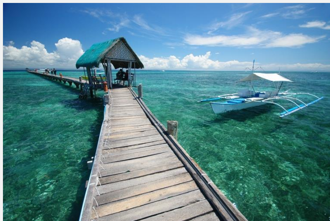
Τα γαλαζοπράσινα νερά της θάλασσας των Φιλιππίνων

Μετά το πρωινό μας αναχωρούμε για το Όσλομπ . Η πόλη είναι γνωστή για τους φαλινοκαρχαρίες που ζουν στα νερά της. Πρόκειται για τα μεγαλύτερα ψάρια του πλανήτη, τα οποία ξεχωρίζουν για τις πιτσιλιές στην πλάτη τους. Εν τούτοις, παρά το εντυπωσιακό μέγεθος, το στόμα τους που φτάνει σε μήκος το 1,5 μ (!) και τις δεκάδες σειρές μυτερών δοντιών είναι φυτοφάγοι, τρέφονται δηλαδή κυρίως