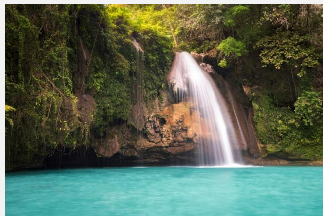
Οι εντυπωσιακοί καταρράκτες Καουασάν