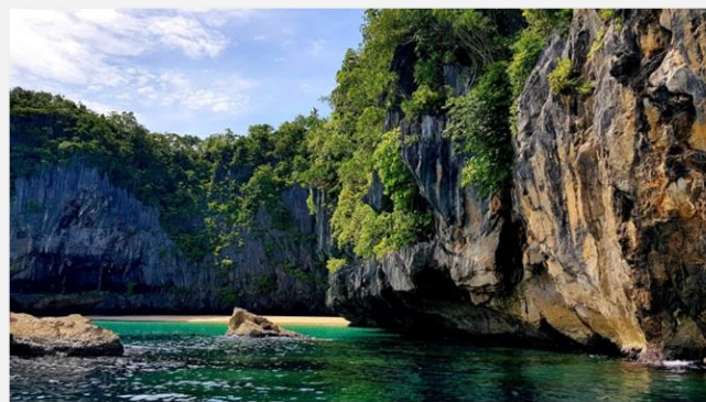
Ο υπόγειος ποταμός στο Πουέρτο Πρινσέζα