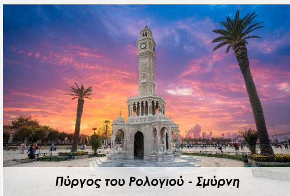
Πύργος του Ρολογιού - Σμύρνη