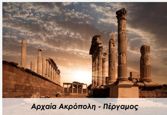
Αρχαία Ακρόπολη - Πέργαμος