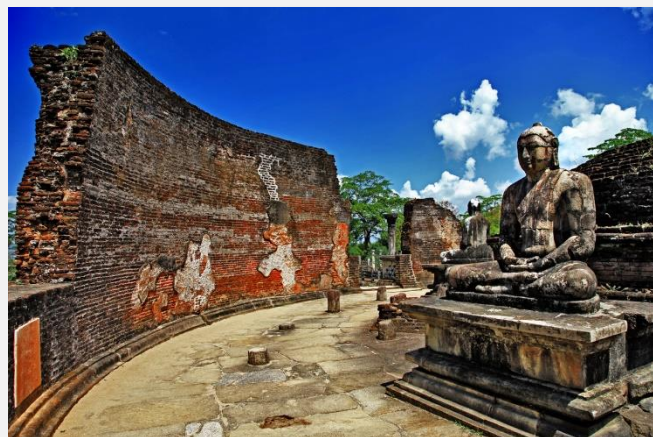
Ο Ναός του Βούδα στην Πολομπάρουα