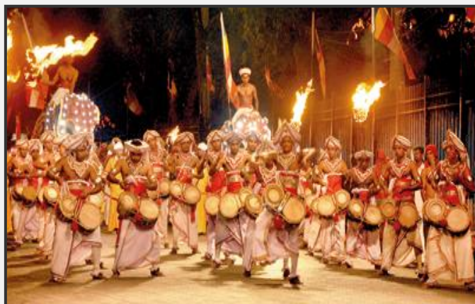
Νυχτερινή παρέλαση στις γιορτές Περαχέρα