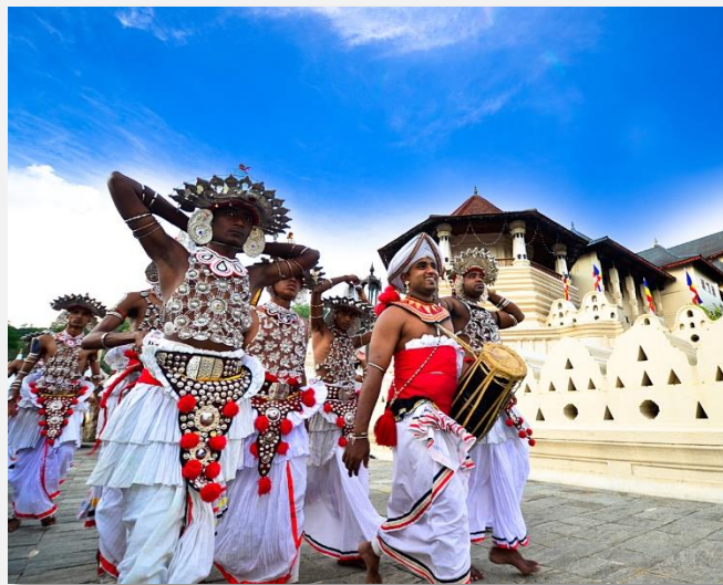
Λαϊκή γιορτή στην Κεϋλάνη

Στην Κάντι μπορούμε να δούμε τους εορτασμούς στις περίφημες γιορτές Περαχέρα, ίσως η μεγαλύτερη ετήσια θρησκευτική γιορτή στην Ασία και σίγουρα η κορυφαία στον βουδισμό. Η συνολική διάρκεια των εορτών φτάνει τις δέκα ημέρες, με χιλιάδες κόσμος να παρελαύνουν χορεύοντας με τυμπανοκρουσίες και συνοδευόμενοι από πολλούς χρυσοποίκιλτα στολισμένους ελέφαντες. Οι γιορτές κορυφώνονται στην πανσέληνο του Ιουλίου-Αυγούστου, με τη μεγάλη παρέλαση όπου