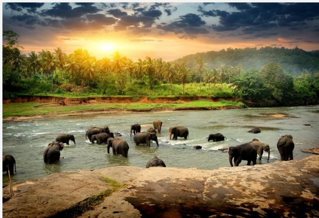
Χαρακτηριστικό τοπίο στη Σρι Λάνκα

Πρωινή αναχώρηση για την πόλη Γκάλε, η οποία θα μας εντυπωσιάσει με το έντονο αποικιακό της χρώμα και την πλούσια ιστορία της, καθώς από την πόλη αυτή πέρασαν διαδοχικά Βρετανοί, Πορτογάλοι και Ολλανδοί. Την προσοχή μας πάντως θα τραβήξει το Φρούριο της πόλης, το