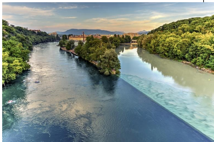
Η συμβολή του Ροδανού με τον ποταμό Αρβ, στη Γενεύη

Μια πόλη γεμάτη ζωή, όπως είναι η Λυών, έχει πολλά να μας αποκαλύψει, από τα μουσεία και τις γραφικές της πλατείες, μέχρι τα λιθόστρωτα καλντερίμια της και τα φημισμένα bouchon και winebars. Σήμερα θα ξεναγηθούμε στο ιστορικό κέντρο της Λυών, μνημείο Παγκόσμιας Πολιτιστικής Κληρονομιάς της UNESCO. Θα δούμε την πανοραμική θέα της πόλης, θα επισκεφθούμε τη συνοικία St. Jean Quartier στο λόφο που εργάζεται, θα δούμε τη βασιλική της NotreDamedelaFourviere που αποκαλείται το παλάτι της Παναγίας στο λόφο που προσεύχεται και θα κάνουμε βόλτα στα περίφημα traboules της Λυών (τα μυστικά περάσματα με τις στοές και τις αλλεπάλληλες σκάλες). Στη συνέχεια, αναχωρούμε από την πόλη, με