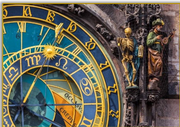
Λεπτομέρεια της παράξενης αρχιτεκτονικής της Πράγας που συμβαδίζει με την πλούσια Ιστορία της: Ένας σκελετός κοσμεί το Αστρονομικό Ρολόι της πόλης

Η πόλη άνθισε τον 14ο αιώνα, καθώς εξελίχθηκε σε σημαντικότερο εμπορικό κέντρο και προσέλκυε εμπόρους από όλη την Ευρώπη. Τότε ενισχύθηκε εκεί και το έντονο εβραϊκό στοιχείο που χαρακτηρίζει την Πράγα και την κουλτούρα της. Μνημεία της εποχής αυτής είναι και ο Καθεδρικός του Αγίου Βίτου μέσα στο κάστρο Χράντσανι, ο παλαιότερος γοτθικός καθεδρικός ναός στην κεντρική Ευρώπη, καθώς και το Πανεπιστήμιο, το παλαιότερο στην κεντρική Ευρώπη.