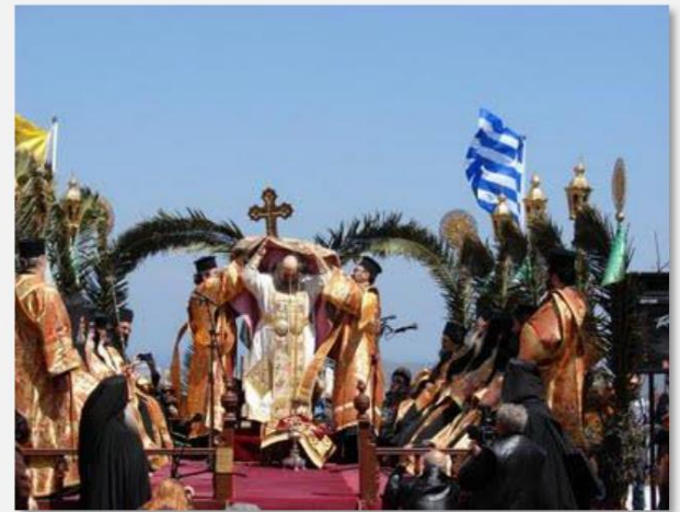
Τελετή του Νιπτήρος