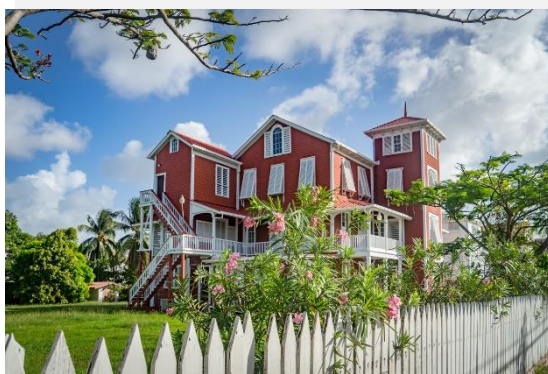
Τζόρτζταουν Βρετανική Γουιάνα