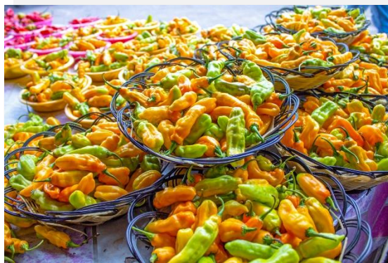
Γεύσεις από το Σουρινάμ