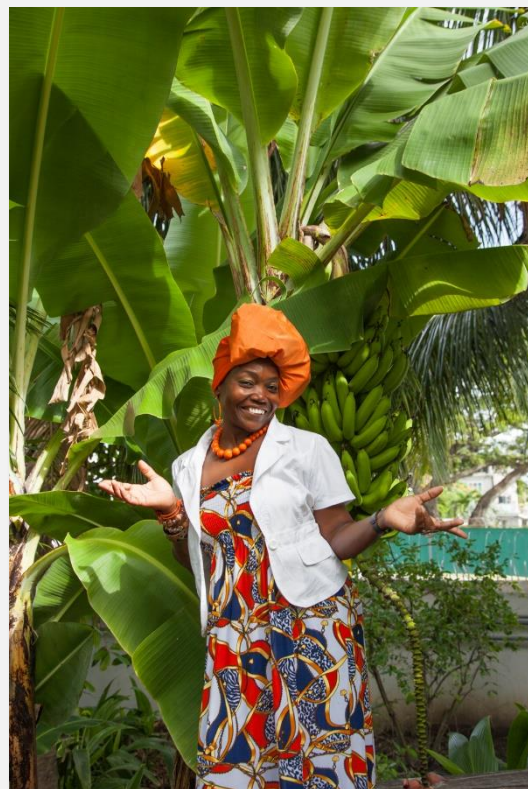
Στη Γαλλική Γουιάνα