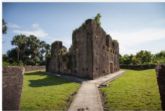
Στο Νησί του Διαβόλου

Σήμερα το πρωί θα αναχωρήσουμε για μία ιδιαίτερη περιοχή. Μια ζώνη παράκτιων ελών και μια ενδοχώρα ισημερινής ζούγκλας συνιστούν έναν τόπο που επί χρόνια ήταν πασίγνωστος ως το "Νησί του Διαβόλου". Μεταξύ 1852 και 1939 η χώρα υπήρξε τόπος εκτόπισης ποινικών καταδίκων από τη Γαλλία. Η νησίδα αυτή είχε μετατραπεί σε φυλακή "υψίστης ασφαλείας" για εγκληματίες και πολιτικούς κρατουμένους και αναδείχθηκε ο προσφιλέστερος τόπος της Γαλλικής Δημοκρατίας για τον εκτοπισμό προδοτών, αλλά και διαφόρων πολιτικών της αντιπάλων, παράλληλα δε και μια από τις πιο κακόφημες φυλακές του κόσμου. Ως φυλακές ξεκίνησαν να λειτουργούν επί του αυτοκράτορα της Γαλλίας Ναπολέοντα Γ' το 1852. Για κάποιο διάστημα η φυλακή αυτή χρησιμοποιήθηκε και ως λεπροκομείο. Το συγκεκριμένο νησιωτικό σύμπλεγμα αποτελείται από τρία νησιά (Royale, St Joseph και Ile du Diable) και έγινε ιδιαίτερα γνωστό από την υπόθεση Dreyfus, ενός καπετάνιου του Γαλλικού Ναυτικού στα τέλη του 19ου αιώνα, που φυλακίστηκε στο νησί για περισσότερες από 1500 ημέρες. Εμείς απολαμβάνουμε ελεύθερο χρόνο και στιγμές χαλάρωσης στις παραλίες του νησιού ενώ το μεσημέρι μας περιμένει ένα εκπληκτικό γεύμα σε εστιατόριο με πανοραμική θέα στον Ατλαντικό Ωκεανό. Το απόγευμα επιστρέφουμε στην πόλη Κούρου για δείπνο και χαλάρωση. Διανυκτέρευση.