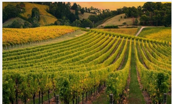
Αμπελώνας στη Γουμένισσα