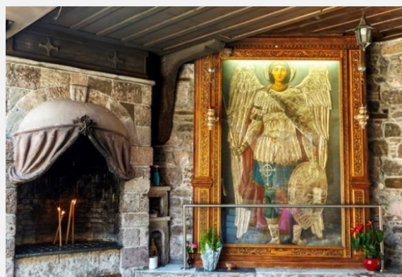
Μονή Ταξιάρχη, Μανταμάδος