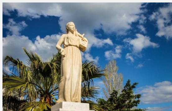
Πλατεία Σαπφούς, Μυτιλήνη