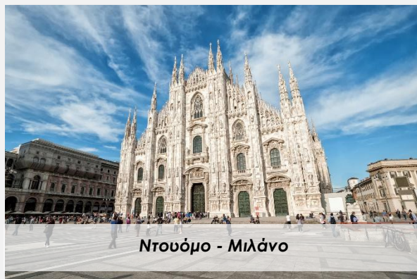
Ντουόμο - Μιλάνο

Μετά από ένα θαυμάσιο πρωινό στο ξενοδοχείο μας θα ξεκινήσουμε μια εκδρομή στην πιο αγαπημένη εξοχή των Μιλανέζων, δηλαδή στην περίφημη Λίμνη Κόμο . Θα περιδιαβάσουμε την όμορφη προκουμαία, θα δούμε την πλατεία και τον επιβλητικό καθεδρικό ναό και θα έχουμε ελεύθερο χρόνο στη διάθεσή μας για περιπάτους καφέ, γεύμα η σνακς.