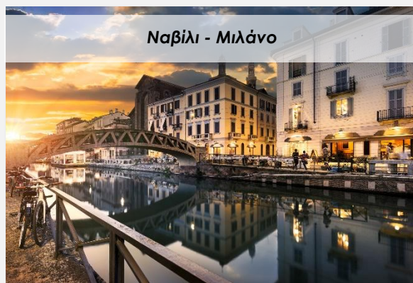
Ναβίλι - Μιλάνο