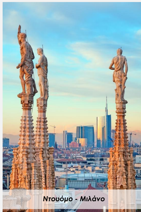
Ντουόμο - Μιλάνο

Πρωινό ελεύθερο για προσωπικές δραστηριότητες. Όσοι επιθυμούν μπορούν να επισκεφτούν με τον αρχηγό εσωτερικά τον Καθεδρικό Ναό (Duomo) ή την Πινακοθήκη της Βρεγα, η οποία φιλοξενεί μία από τις σπουδαιότερες συλλογές τέχνης της Ιταλίας με αριστουργήματα εξαιρετικών ζωγράφων από τον 13ο