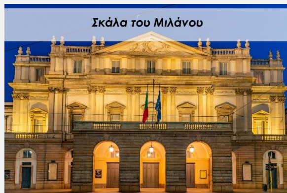
Σκάλα του Μιλάνου