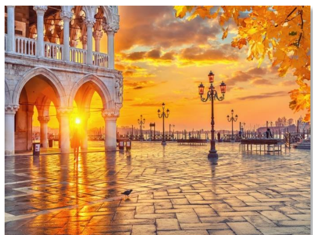
Η πλατεία Σαν Μάρκο το απόγευμα. Αυτή είναι η καλύτερη ώρα για να απολαύσετε ένα aperitif στο καφέ Florian