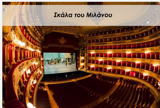
Σκάλα του Μιλάνου