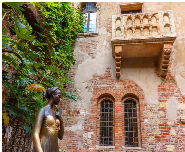
Το μπαλκόνι της Ιουλιέτας, εκεί όπου στο γνωστό σαιξπηρικό έργο αρχίζει το διασημότερο ερωτικό δράμα στον κόσμο!

Η Βερόνα είναι πόλη της βόρειας Ιταλίας και έδρα της περιφέρειας του Βένετο. Βρίσκεται στις όχθες του ποταμού Αδίγη. Αποτελεί βασικό τουριστικό προσορισμό στον Ιταλικό Βορρά, χάρη στην καλλιτεχνική κληρονομιά της, τις ετήσιες εκθέσεις, τις παραστάσεις λυρικού θεάτρου στην περίφημη Αρένα – αρχαίο αμφιθέατρο που χτίστηκε από τους Ρωμαίους. Όμως τη Βερόνα την έκανε παγκοσμίως γνωστή ο Σαίξπηρ... Τρία έργα του διαδραματίζονται εκεί: «Ρωμαίος και Ιουλιέτα», «Οι δύο κύριοι της Βερόνα», «Το ημέρωμα της στρίγγλας». Κατά τα άλλα η πόλη έχει χαρακτηριστεί ως Μνημείο Παγκόσμιας Πολιτιστικής Κληρονομιάς από την UNESCO, λόγω της αστικής δομής και της αρχιτεκτονικής της. Η Βερόνα γενικώς χαρακτηρίζεται για την κοσμοπολίτικη αίγλη που της δίνουν το καλοδιατηρημένο ιστορικό κέντρο, οι φινετσάτες βιτρίνες των καταστημάτων και τα εστιατόρια υψηλής γαστρονομίας.