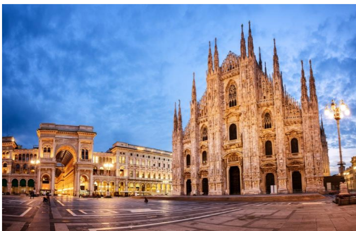
Ο καθεδρικός του Μιλάνου στην πλατεία Ντουόμο είναι ο 2ος παγκοσμίως μεγαλύτερος γοθικός ναός, μετά τον αντίστοιχο της Σεβίλλης.

Μεγάλο πέρασμα στο Μιλάνο αποτελεί και το εμπορικό κέντρο Γκαλερία Βιτόριο Εμανουέλε Β', που κατασκευάστηκε τον 19ο αιώνα και βρίσκεται χωροταξικά ανάμεσα στη Σκάλα και στο Ντουόμο. Πρόκειται για ένα σύμπλεγμα δύο τετραώροφων στοών που σχηματίζουν σταυρό και ενώνονται σε έναν μεγάλο γυάλινο θόλο. Η οροφή της Γκαλερίας αναγνωρίζεται ως σημείο αναφοράς για την αρχιτεκτονική σιδήρου και γυαλιού του 19ου αιώνα και η κατασκευή της από ήταν αποτέλεσμα διεθνούς συνεργασίας. Το μωσαϊκό στο πάτωμα των στοών αναπαριστά το στέμμα του οίκου της Σαβοΐας και τα οικόσημα των ιταλικών επαρχιών. Η είσοδος από την πλατεία Ντουόμο γίνεται μέσω θριαμβικής αψίδας. Μιλάμε για μεγαλειώδες έργο! Λέγεται όμως ότι ο αρχιτέκτονας της Γκαλερίας, Τζουζέπε Μενγκόνι, λίγο πριν την αποπεράτωσή του έπεσε από μία σκαλωσιά και σκοτώθηκε κι έτσι δεν το είδε ποτέ ολοκληρωμένο. Μέσα στην Γκαλερία στεγάζονται πολλοί οίκοι μόδας αλλά και διάσημα καφέ και εστιατόρια. Όπως είναι το Biffi Caffè (το οποίο ιδρύθηκε το 1867 από τον Πάολο Μπίφι, ζαχαροπλάστη του βασιλιά), το Savini και το αρ νουβώ Camperano in Galleria.