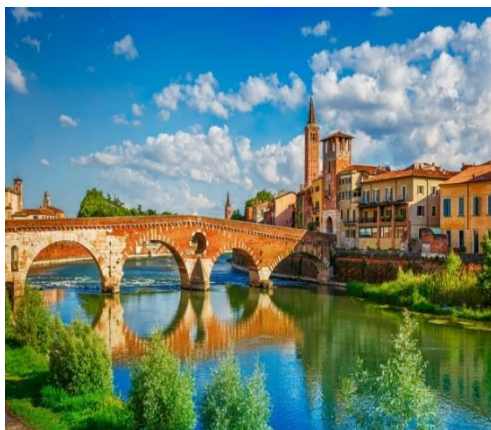
Η γέφυρα Πιέτρα στον Αδίγη ποταμό που βρέχει τη Βερόνα. Στα αριστερά, μεσαιωνικά σπίτια στην απόχρωση της τερακότα – το τυπικό χρώμα της

Εξόριστος από τη Φλωρεντία. Ορόσημο επίσης αποτελεί ο Πύργος των Λαμπέρτι ο οποίος άρχισε να χτίζεται τον 12ο αιώνα, ολοκληρώθηκε το 1463 και σήμερα προσφέρει πανοραμική θέα σε όλη την περιοχή. Όσο για τους ναούς, υπάρχουν πολλοί όπως σε κάθε μεσαιωνική και αναγεννησιακή πόλη. Ωστόσο εδώ, ο σημαντικότερος είναι ο Καθεδρικός Σάντα Μαρία Ματρικολάρε στην Πιάτσα Βεσκοβάντο. Είναι γοθικού ρυθμού και ίσως ο μεγαλύτερος στη Βερόνα.