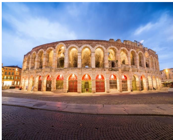
Η ρωμαϊκή Αρένα της Βερόνα, σήμερα φιλοξενεί σπουδαίες λυρικές παραστάσεις.

Εξόριστος από τη Φλωρεντία. Ορόσημο επίσης αποτελεί ο Πύργος των Λαμπέρτι ο οποίος άρχισε να χτίζεται τον 12ο αιώνα, ολοκληρώθηκε το 1463 και σήμερα προσφέρει πανοραμική θέα σε όλη την περιοχή. Όσο για τους ναούς, υπάρχουν πολλοί όπως σε κάθε μεσαιωνική και αναγεννησιακή πόλη. Ωστόσο εδώ, ο σημαντικότερος είναι ο Καθεδρικός Σάντα Μαρία Ματρικολάρε στην Πιάτσα Βεσκοβάντο. Είναι γοθικού ρυθμού και ίσως ο μεγαλύτερος στη Βερόνα.