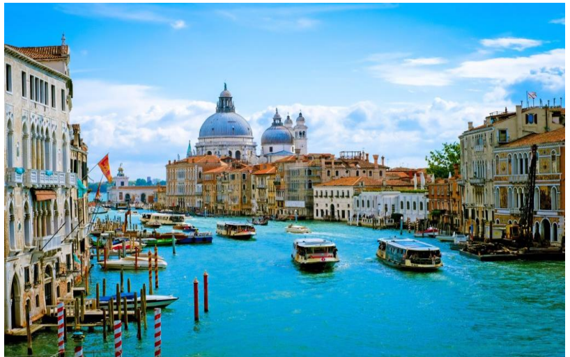
Θέα στο Μεγάλο Κανάλι της Βενετίας. Στο βάθος ξεχωρίζει ο τρούλος της Βασιλικής Σάντα Μαρία Σαλούτε.

Είναι χτισμένη πάνω σε 118 μικρά νησιά που χωρίζονται από κανάλια και επικοινωνούν με γέφυρες. Είναι πρωτεύουσα της Περιφέρειας του Βένετο και βρίσκεται στην ομώνυμη ελώδη λιμνοθάλασσα που απλώνεται κατά μήκος της ακτογραμμής μεταξύ των ποταμών Πάδου και Πιάβε. Φημίζεται για την ομορφιά της τοποθεσίας της, την αρχιτεκτονική και τα έργα τέχνης. Ολόκληρη η πόλη είναι καταγεγραμμένη ως Μνημείο Παγκόσμιας Κληρονομιάς, μαζί με τη λιμνοθάλασσά της. Ολόκληρη η πόλη είναι ένα μουσείο.