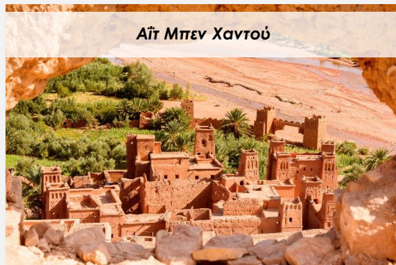
Αϊτ Μπεν Χαντού

Την αποκάλεσαν «η αυτοκράτειρα των πόλεων». Σήμερα δεν έχουν αλλάξει πάρα πολλά πράγματα