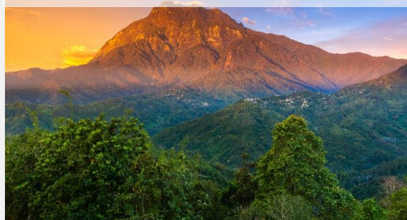
Θέα στο όρος Κιναμπαλού