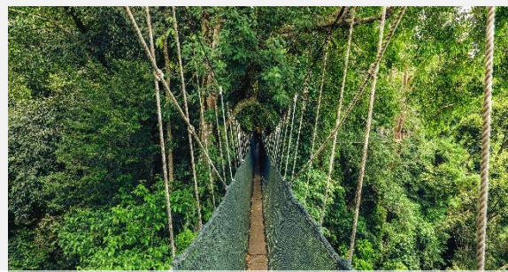
κρεμαστή σχοινένια γέφυρα