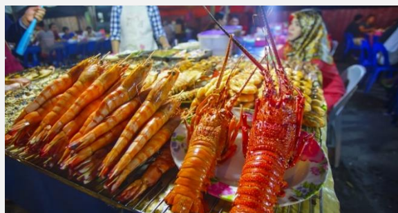
Βραδινή αγορά της Κότα Κιναμπαλού

Στη συνέχεια θα αναχωρήσουμε για ένα ακόμα εντυπωσιακό θαύμα της φύσης, τις Θερμές πηγές Πόρινγκ που βρίσκονται σε απόσταση περίπου 47 χιλιομέτρων από το πάρκο Κιναμπαλού. Οι πηγές πήραν το όνομά τους από το ψηλό φυτό μπαμπού που αφθονεί στην περιοχή. Εδώ θα χαλαρώσουμε και θα αφήσουμε