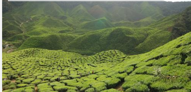
Φυτεία τσαγιού στα Υψίπεδα Κάμερον

Άλλη μία συναρπαστική μέρα στη φύση ξεκινάει. Αφού πάρουμε το πρωινό μας στο ξενοδοχείο, ακολουθούμε τον οδηγό μας σε μια εξερεύνηση στο τροπικό δάσος που θα μας γεμίσει εικόνες και εμπειρίες μοναδικές. Διασχίζουμε την κοιλάδα Μπελούμ, ανακαλύπτουμε όλες τις κρυφές αλήθειες αυτού του συναρπαστικού οικοσυστήματος, την πανίδα, τα δένδρα, τα λουλούδια. Δεν είναι τυχαίο ότι το τροπικό δάσος στο Μπελούμ αποτελεί μια πλούσια εθνική κληρονομιά της Μαλαισίας. Αυτό το τελευταίο σύνορο της χερσονήσου της Μαλαισίας καλεί τους περιπετειώδεις ταξιδιώτες να γνωρίσουν την αιώνια γοητεία του. Θα απολαύσουμε ένα οδοιπορικό στη ζούγκλα και με λίγη τύχη, θα βρούμε το «Rafflesia» - το μεγαλύτερο άγριο λουλούδι στον κόσμο.