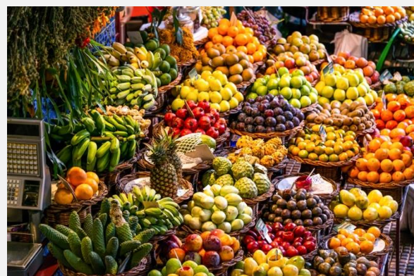
Η αγορά Mercado dos Lavradores