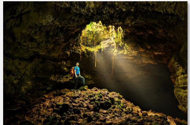
Σπηλιές Αλγκάρ ντο Καρβάο

Αφού απολαύσουμε το πρωινό μας ξεκινάμε την εξερεύνηση στο νησί. Πρώτα ερχόμαστε στην όμορφη Ριμπέιρα Γκράντε , στο βόρειο τμήμα του νησιού, με έναν εξαιρετικό βοτανικό κήπο και το δημαρχιακό