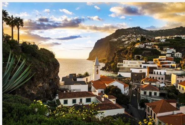
Κάμαρα ντε Λόμπος

Αφού ξεκουραστούμε θα πάμε να γνωρίσουμε την πόλη. Η Άγκρα ντο Εροΐσμου έχει χαρακτηριστεί ολόκληρη Μνημείο της UNESCO από το 1983, με το ιστορικό της κέντρο να αποτελείται από όμορφους δρόμους, ναούς, μέγαρα, μνημεία, πλατείες και πλούσιους κήπους. Θα δούμε, μεταξύ άλλων, το δημαρχιακό μέγαρο, τον Κήπο Ντούκε ντε Τερσεΐρα με είδη λουλουδιών και άνθεων από όλο τον κόσμο, και πολλά ακόμα σημεία ενδιαφέροντος στην πόλη.