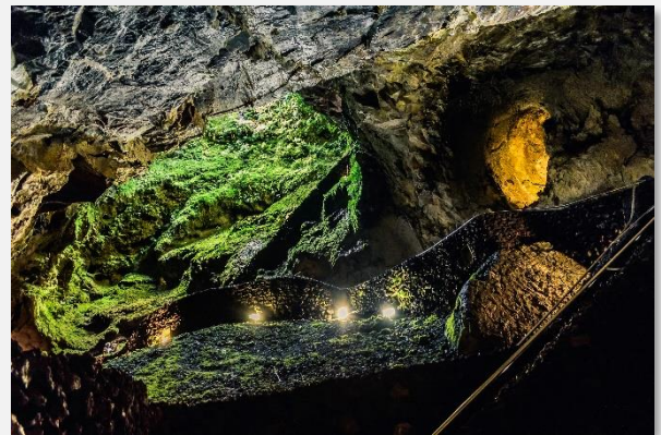
Αλγκάρ ντο Καρβάο