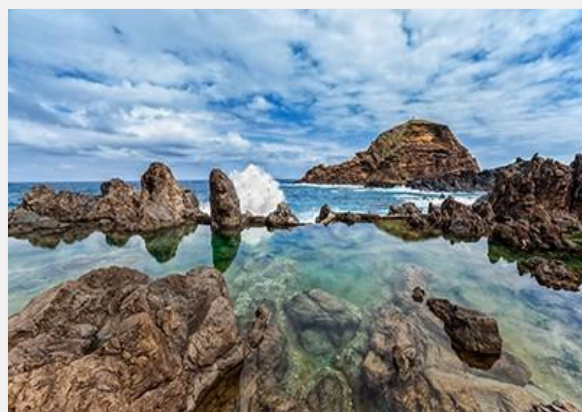
Ηφαιστειακές πισίνες, Πόρτο Μονίζ