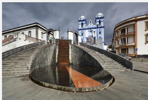
Άγκρα ντο Εροΐσμου