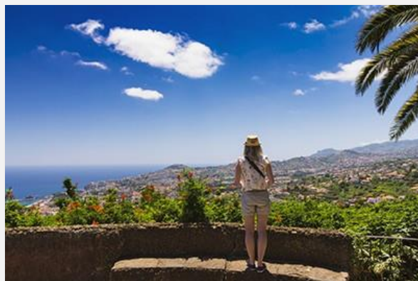
Πανοραμική θέα στη Φουντσάλ

Στη συνέχεια θα επισκεφτούμε την παλιά πόλη της Φουντσάλ, γνωστή για τα στενά πλακόστρωτα δρομάκια της, που στολίζονται από τις χαρακτηριστικές προσόψεις των παλιών σπιτιών. Σε αυτό βοήθησε και το