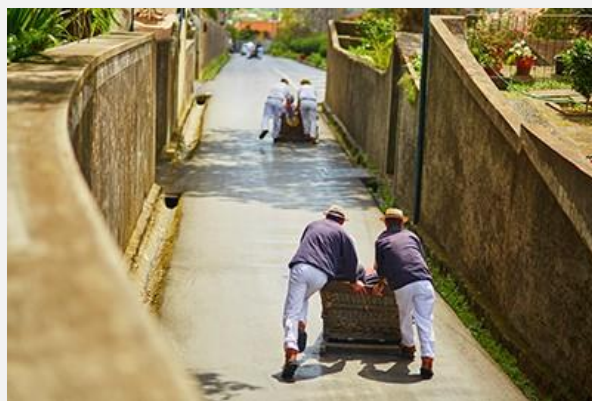
Κατάβαση με toboggan στη Φουντσάλ