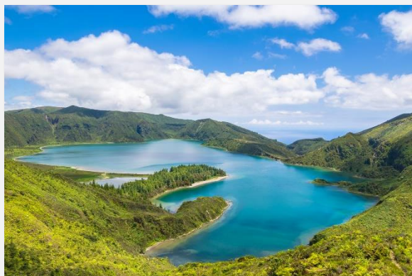
Λαγκόα ντο Φόγκο