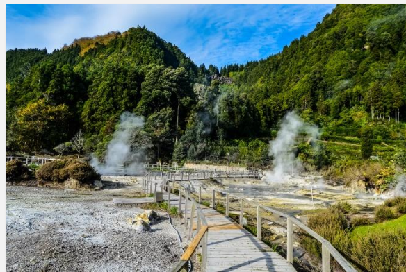
Θερμές πηγές - Φούρνας

Αργότερα θα κατευθυνθούμε με τζιπ προς το Σέτε Σιντάντες , μια περιοχή στο κέντρο ενός τεράστιου ηφαιστειακού κρατήρα τριών μιλίων! Εκεί θα έχουμε την ευκαιρία να περπατήσουμε σε ένα υπέροχο καταπράσινο τοπίο που δύσκολα περιγράφεται με λόγια, θα επισκεφτούμε το ομώνυμο χωριό, καθώς και την λίμνη Σαντιάγκο η θέα της οποίας κυριολεκτικά σου κόβει την ανάσα!