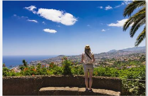
Πανοραμική θέα στη Φουντσάλ

Στη συνέχεια θα επισκεφτούμε την παλιά πόλη της Φουντσάλ, γνωστή για τα στενά πλακόστρωτα δρομάκια της, που στολίζονται από τις χαρακτηριστικές προσόψεις των παλιών σπιτιών. Σε αυτό βοήθησε και το