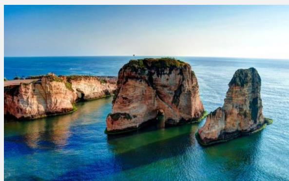
Η σπηλιά των σπουργιτιών