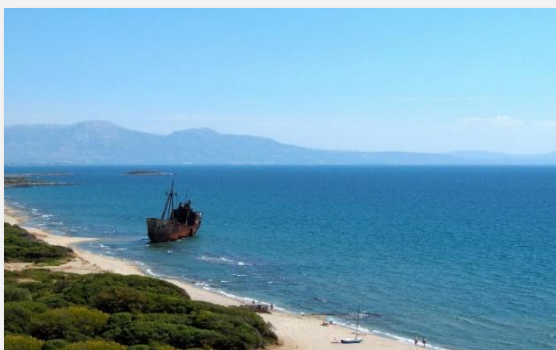
Ναυάγιο στο Βαλτάκι, Γύθειο