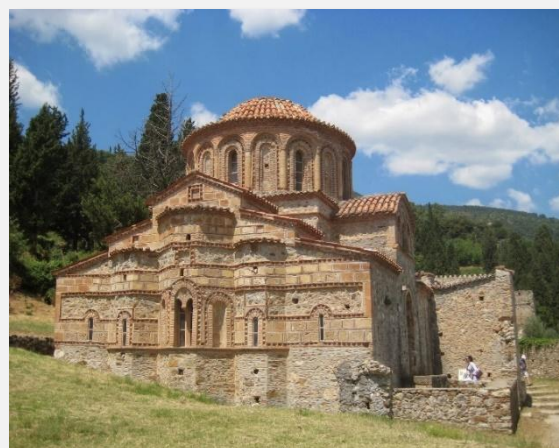
Βυζαντινός ναός Αγίας Σοφίας, Μυστράς

Η σειρά των ξεναγήσεων μπορεί να αλλάξει για την καλύτερη εκτέλεση του προγράμματος, χωρίς να παραλειφθεί κάτι από τα αναγραφόμενα σε αυτό.