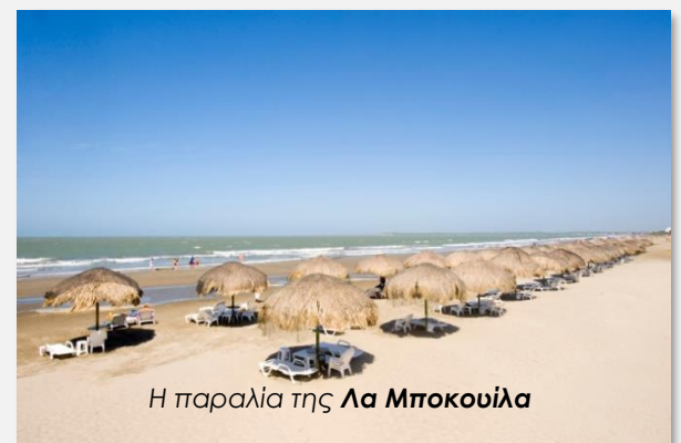
Η παραλία της Λα Μποκουίλα