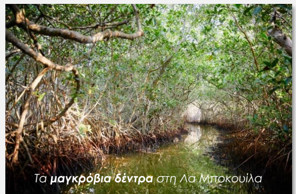
Τα μαγκρόβια δέντρα στη Λα Μποκουίλα