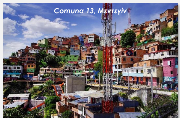
Comuna 13, Μεντεγίν