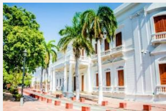
Αποικιακή αρχιτεκτονική στη Σάντα Μάρτα