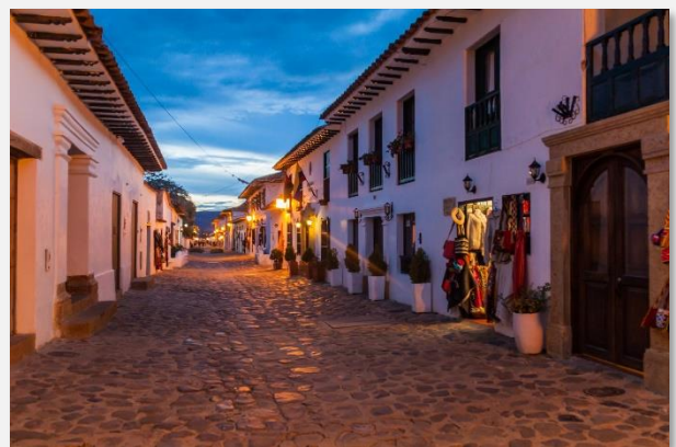
Βίγια ντε Λέιβα