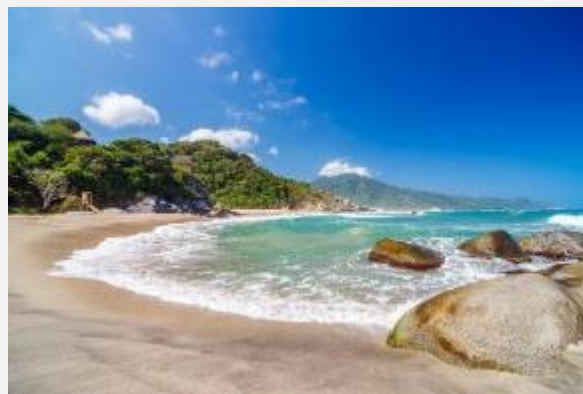
Στην Ταϊρόνα οι ήσυχες αμμουδιές είναι αμέτρητες