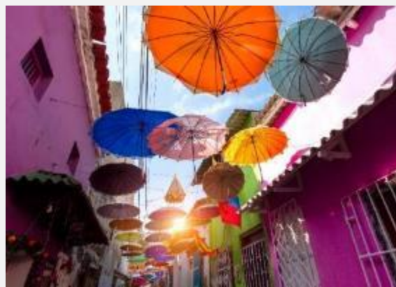
Στη συνοικία Γκετσεμάνι , στην Καρθαγένη

Παράλληλα, θα δούμε τους ψαράδες που ζουν περιμετρικά και εκμεταλλεύονται τη ζωή της λίμνης, ενώ και