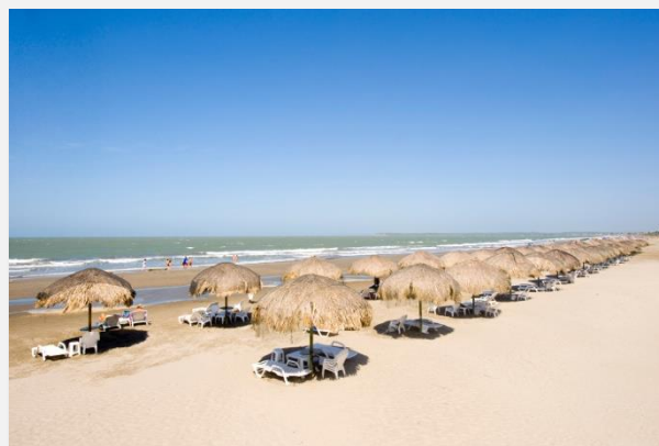
Η παραλία της Λα Μποκουίλα