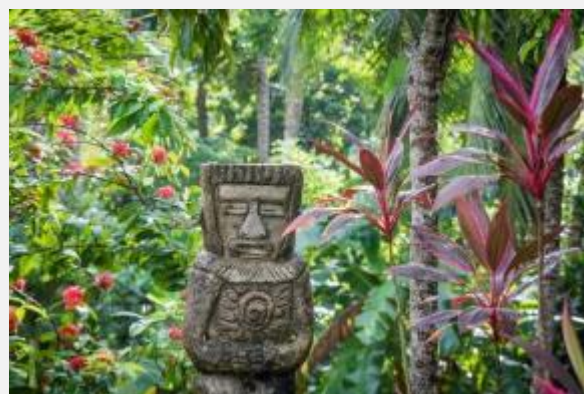
Δείγμα προκολομβιανού πολιτισμού στη ζούγκλα της Τσιρόνα