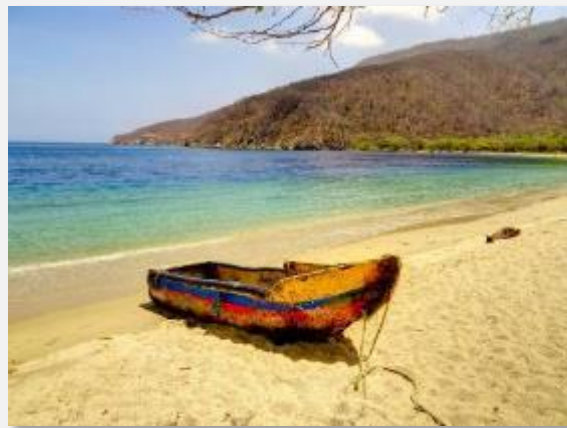
Χρυσάφενια αμμουδιά στο Πάρκο Ταϊρόνα

Η Καρθαγένη , επισήμως Καρθαγένη των Ινδιών (ως γνωστόν ο Κολόμβος όταν ανακάλυψε την Αμερική νόμιζε ότι βρισκόταν στις Ινδίες...), ιδρύθηκε το 1533 και υπήρξε στρατηγικής σημασίας λιμάνι για τους Ισπανούς κονκισταδόρες. Διαμέσου των ποταμών Μαγκνταλένα και Σινού που διασχίζουν την Κολομβία και εκβάλλουν στην Καραϊβική Θάλασσα μπορούσαν να ελέγξουν όλη τη χώρα (τότε Νέα Γρανάδα) και να αναπτύξουν ισχυρούς εμπορικούς δεσμούς με την Ισπανία και τις υπερπόντιες κτήσεις της. Από το λιμάνι της Καρθαγένης εμπορεύονταν κυρίως περουβιανό χρυσό και εισήγαγαν σκλάβους από