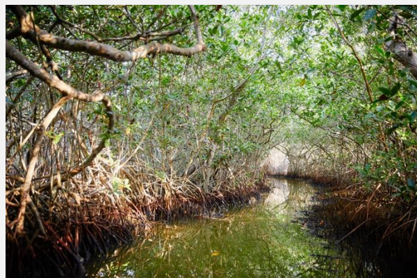
Τα μαγκρόβια δέντρα στη Λα Μποκουίλα