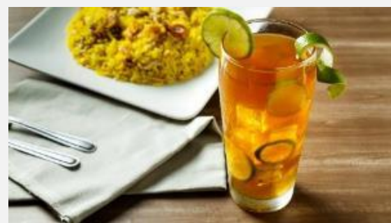
Ρόφημα από πανέλα