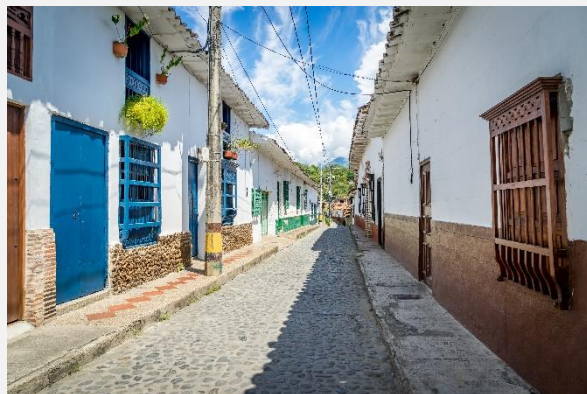
Σάντα Φε ντε Αντιόχεια

Το παραπάνω πρόγραμμα είναι ενδεικτικό. Το τελικό ενημερωτικό αποστέλλεται περίπου 3-5 ημέρες πριν από την εκάστοτε αναχώρηση.