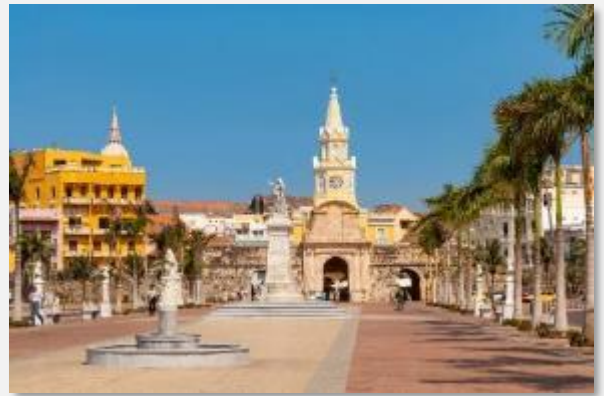
Η Καρθαγένη είναι σίγουρα η πόλη με τα χίλια χρώματα

Εμείς θα επιβιβαστούμε σε σκάφος και θα επισκεφτούμε ένα από τα νησιά Ροζάριο για να απολαύσουμε τις