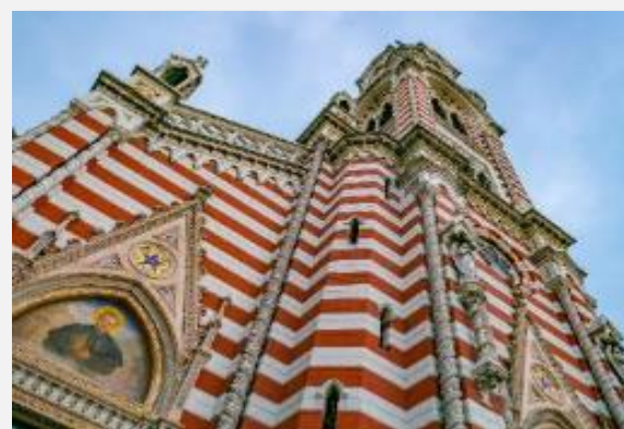
Χαρακτηριστικό δείγμα εκκλησιαστικής αρχιτεκτονικής στην Μπογκοτά