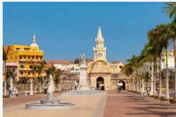
Η Καρθαγένη είναι σίγουρα η πόλη με τα χίλια χρώματα

Εμείς θα επιβιβαστούμε σε σκάφος και θα επισκεφτούμε ένα από τα νησιά Ροζάριο για να απολαύσουμε τις