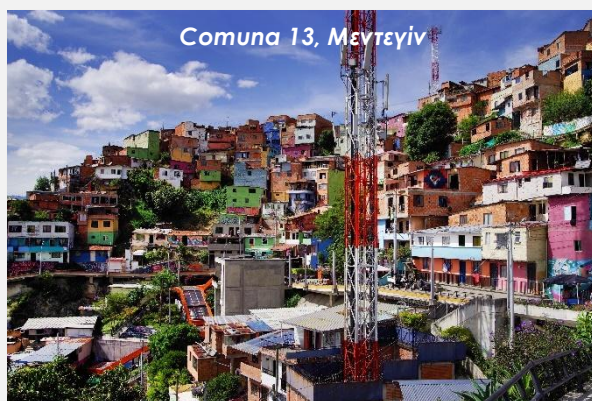
Comuna 13, Μεντεγίν