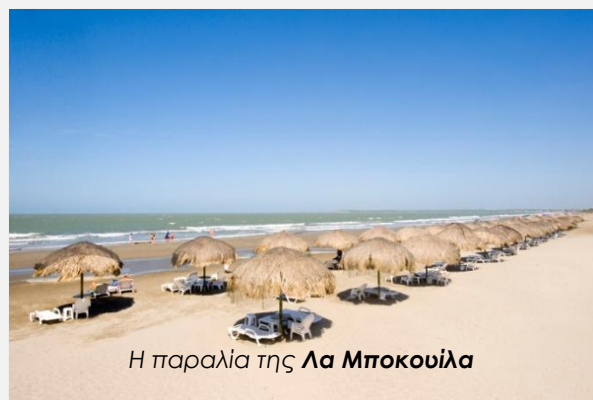
Η παραλία της Λα Μποκουίλα