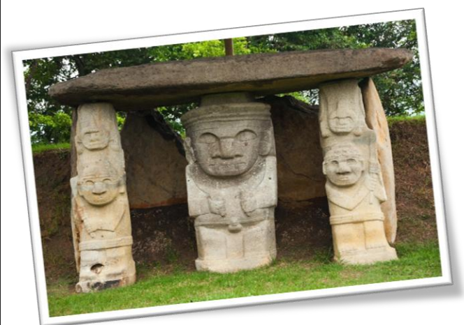
Στο Δάσος με τα Αγάλματα, στο Σαν Αγκουστίν...