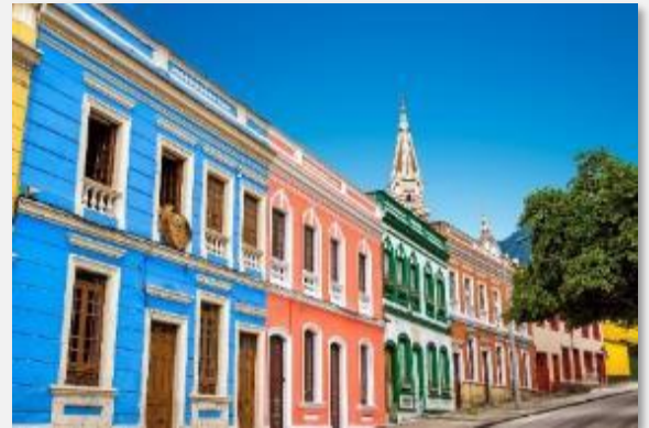
Πολύχρωμες προσόψεις στην Καντελαρία