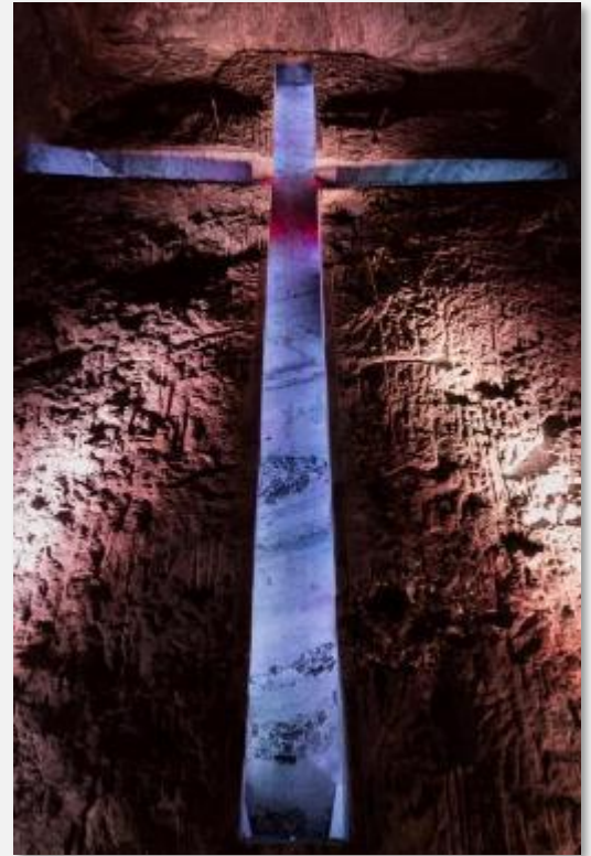
Ο πελώριος σταυρός στα αλατωρυχεία της Ζιπακίρα

Επόμενος σταθμός στην ξενάγησή μας είναι το Μουσείο Φερνάντο Μποτιέρο , το οποίο στεγάζεται σε