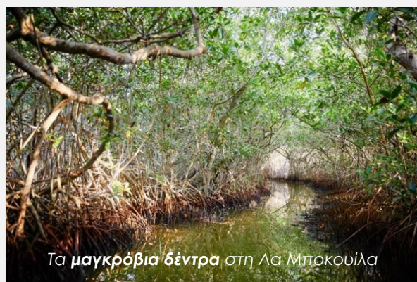
Τα μαγκρόβια δέντρα στη Λα Μποκουίλα