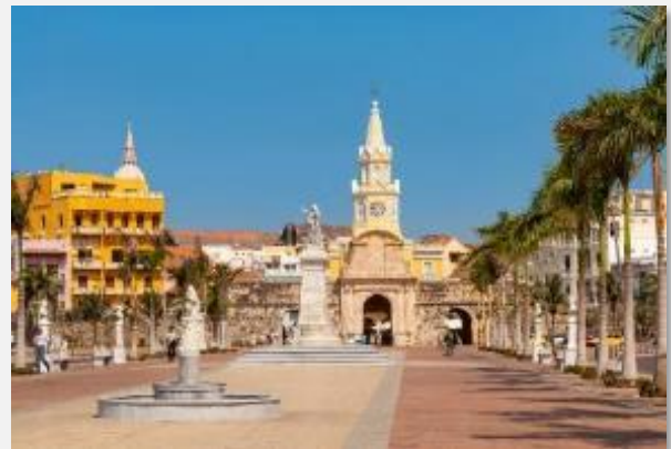
Η Καρθαγένη είναι σίγουρα η πόλη με τα χίλια χρώματα