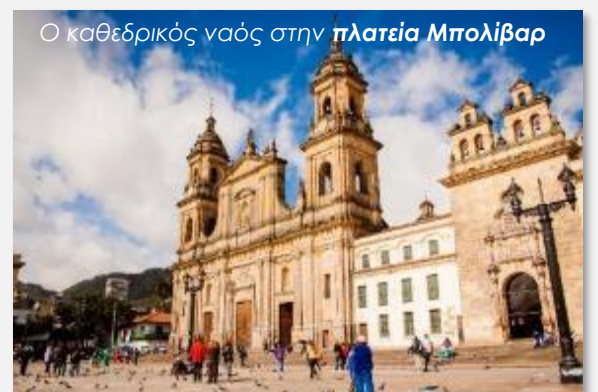
Ο καθεδρικός ναός στην πλατεία Μπολίβαρ