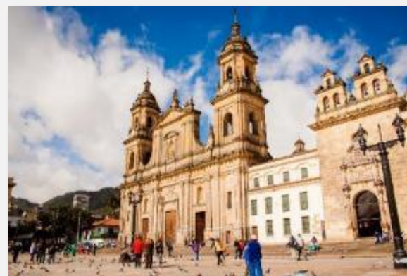
Ο καθεδρικός ναός στην πλατεία Μπολίβαρ