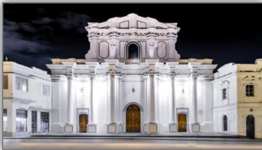
Ο Καθερικός της Ποπαγιάν στον οποίο εκτιθόταν ως τάμα από το 1599 έως το 1936 η κορώνα των Άνδεων

Τον 16 ο αιώνα λοιπόν άρχισε η κατασκευή της κορώνας η οποία ολοκληρώθηκε τον 18 ο αιώνα. Φιλοτεχνήθηκε σε υπερφυσικό μέγεθος και λαμπρότητα και προορισμός της ήταν να κοσμήσει το κεφάλι του αγάλματος της Παναγίας στον Καθεδρικό του Ποπαγιάν. Όπως και έγινε. Το πρώτο τμήμα της κορώνας εγκαινιάστηκε στον ναό το 1599. Η δωρεά ήταν τάμα – παράκληση στην Παναγία να σταματήσει μια φονική επιδημία ευλογιάς που απειλούσε να αφανίσει