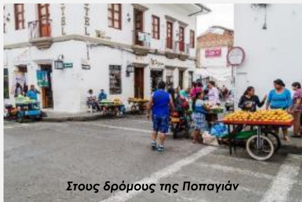
Στους δρόμους της Ποπαγιάν