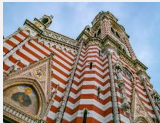
Χαρακτηριστικό δείγμα εκκλησιαστικής αρχιτεκτονικής στην Μπογκοτά

Σειρά έχει το Μουσείο του Χρυσού όπου θα δούμε τη μόνη συλλογή που απαρτίζεται από 32.000 εκθέματα και 20.000 πολύτιμους και ημιπολύτιμους λίθους! Ας μην ξεχνάμε ότι τα εδάφη της Κολομβίας είναι εξαιρετικά πλούσια