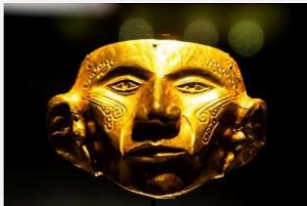
Στο Μουσείο Χρυσού , Μπογκοτά