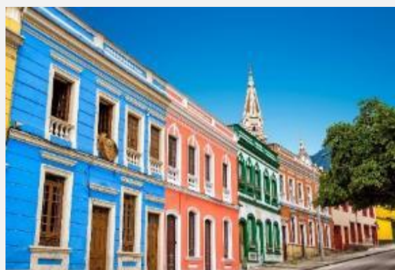
Πολύχρωμες προσόψεις στην Καντελαρία