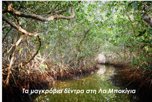
Τα μαγκρόβια δέντρα στη Λα Μποκίγια