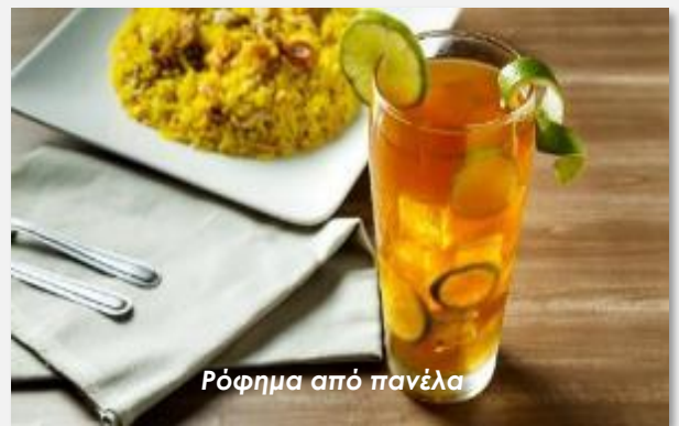
Ρόφημα από πανέλα