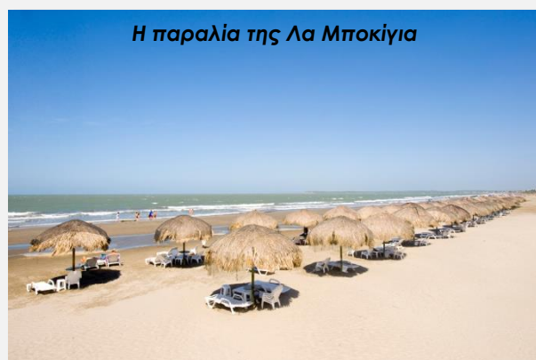
Η παραλία της Λα Μποκίγια