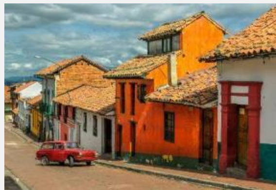
Έντονο το παραδοσιακό χρώμα στην Καντελαρία