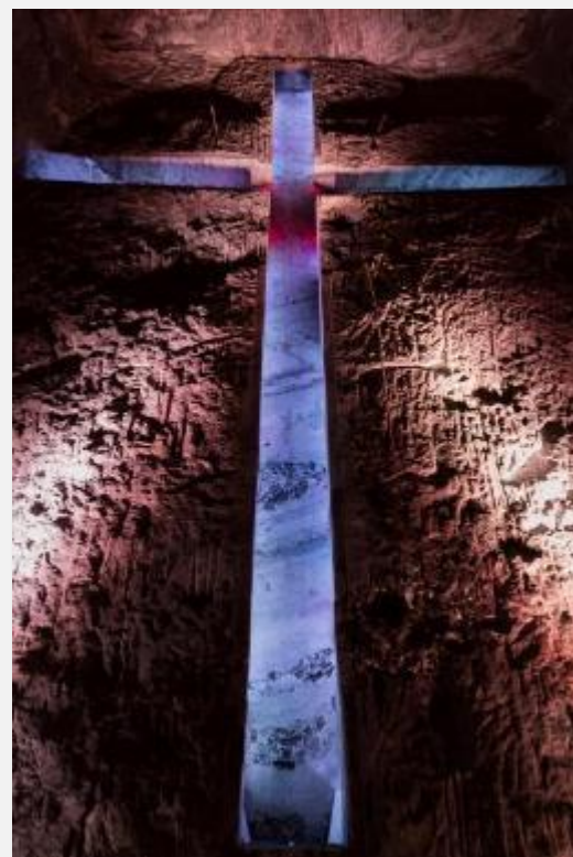
Ο πελώριος σταυρός στα αλατωρυχεία της Ζιπακίρα