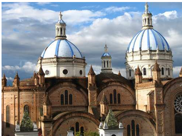
Putumarungo, ανάμεσα σε σπίτια, δρόμους και μοντέρνα

Η Κουένκα ιδρύθηκε από τους Ισπανούς το 1557. Στην παλιά πόλη υπάρχουν εκκλησίες και άλλα κτίρια του 16ου και 17ου αι. Τα περισσότερα σπίτια της βρίσκονται στις όχθες των 4 ποταμών της (Tarquí, Yanucay, Tomebamba και Machiguara). Τα καλντερίμια της, τα πανέμορφα μπαλκόνια και οι κήποι, της δίνουν μια ξεχωριστή ατμόσφαιρα. Η πόλη είναι επίσης γνωστή για τα φημισμένα χειροποίητα ψάθινα καπέλα "τοκίλα" ή "καπέλα Παναμά". Κατά τη διάρκεια της ξενάγησής μας θα διαπιστώσουμε γιατί η πόλη αυτή θεωρείται από τις πιο όμορφες της χώρας. Εντός της ημέρας θα επισκεφθούμε επίσης τον αρχαιολογικό χώρο των Ίνκας "Todos los Santos", που ανακαλύφθηκε μόλις το 1972 στην γειτονιά Putumarungo, ανάμεσα σε σπίτια, δρόμους και μοντέρνα κτίρια. Επιστροφή στο ξενοδοχείο μας. Διανυκτέρευση.