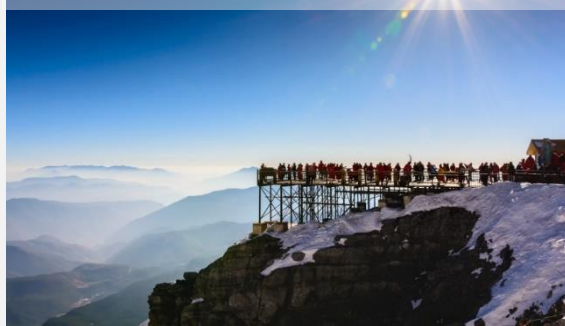
Χιονισμένο Βουνό του Πράσινου Δράκου

Στην τεράστια λίμνη Ερχάι του Νταλί, δημιουργήθηκε πρόσφατα ένας οικολογικός διάδρομος μήκους 129