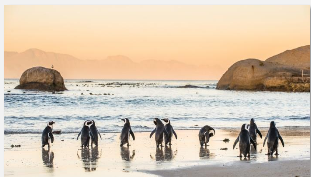
Αφρικανικοί πιγκουίνοι στην άμμο κατά το ηλιοβασίλεμα