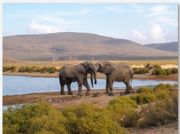
Ελέφαντες παίζουν στο Aquila Private Game Reserve