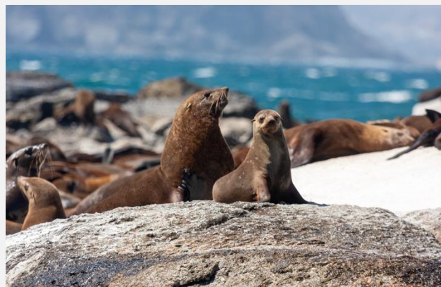
Το πανέμορφο Σάιμονσταουν

Σε αυτή την πόλη με την τόση ιδιαίτερη ιδιοσυγκρασία, ένα αληθινό κράμα αφρικανικής και