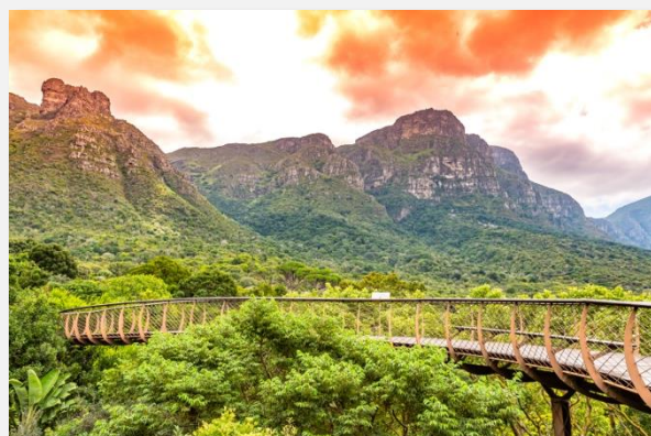
Ο Βοτανικός Κήπος Kirstenbosch