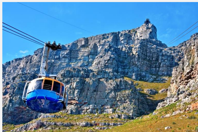
Το τελεφερίκ που θα μας μεταφέρει στην κορυφή του Τέιμπλ Μάουντεν