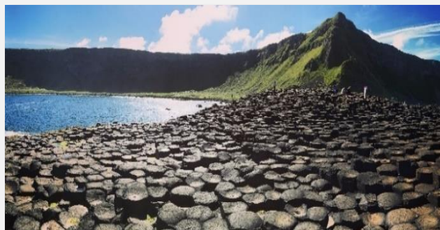
Η Ακτή των Γιγάντων

Συνεχίζοντας την γνωριμία μας με το Δουβλίνο, θα δούμε το Κοινοβούλιο , τον καθεδρικό ναό της Εκκλησίας του Χριστού, και την πλατεία του Αγίου Στεφάνου , που είναι αντιπροσωπευτική γειτονιά Γεωργιανής περιόδου του 18ου αιώνα, με τους όμορφους δρόμους και τις χαρακτηριστικές πολύχρωμες πόρτες των σπιτιών. Τέλος, θα επισκεφθούμε το φημισμένο Κολλέγιο Τρίνιτυ , με την