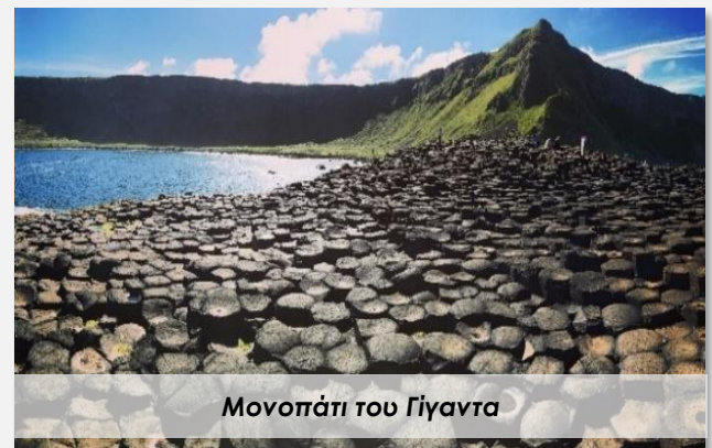
Μονοπάτι του Γίγαντα