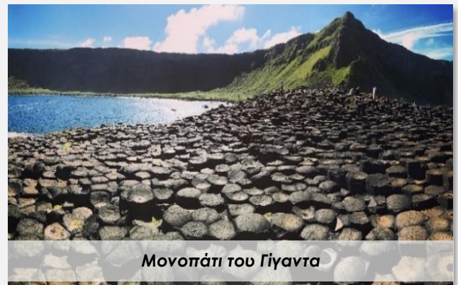
Μονοπάτι του Γίγαντα