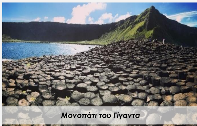
Μονοπάτι του Γίγαντα