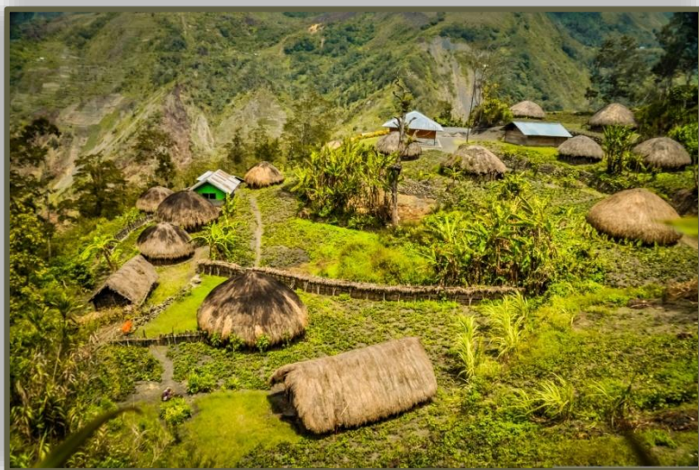
Παραδοσιακά σπίτια της φυλής Ντάνι

Το ταξίδι στη Δυτική Παπούα δεν είναι ένα απλό ταξίδι, είναι εμπειρία ζωής! Και ένας απαιτητικός ταξιδιώτης που θέλει να κερδίσει το μέγιστο από την εμπειρία αυτή ξέρει ότι το Versus Travel μπορεί να του το εξασφαλίσει.