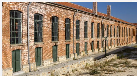
Το παλιό μεταξουργείο Τζίβρε, στο Σουφλί