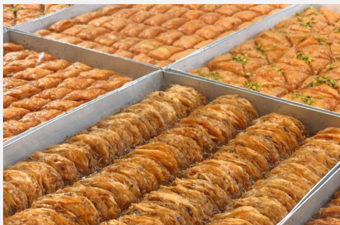
Κομοτηνή σημαίνει γεύσεις