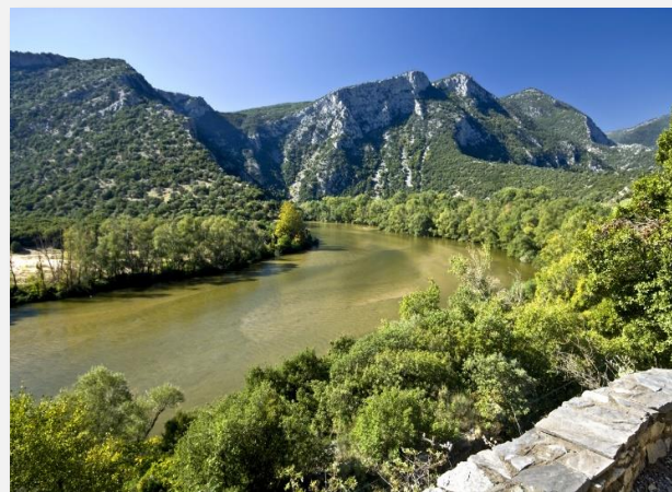
Στην κοιλάδα του Νέστου