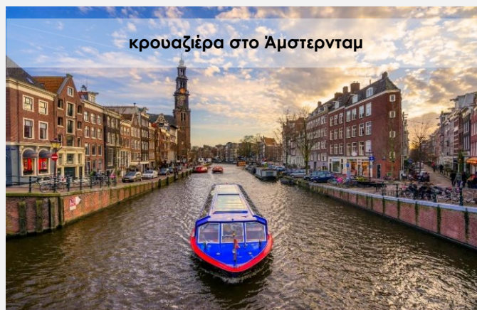
κρουαζιέρα στο Άμστερνταμ