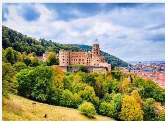
Το κάστρο της Χαϊδελβέργης