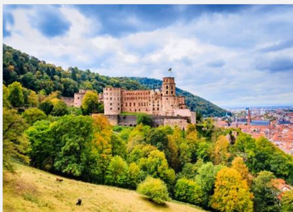
Το κάστρο της Χαϊδελβέργης