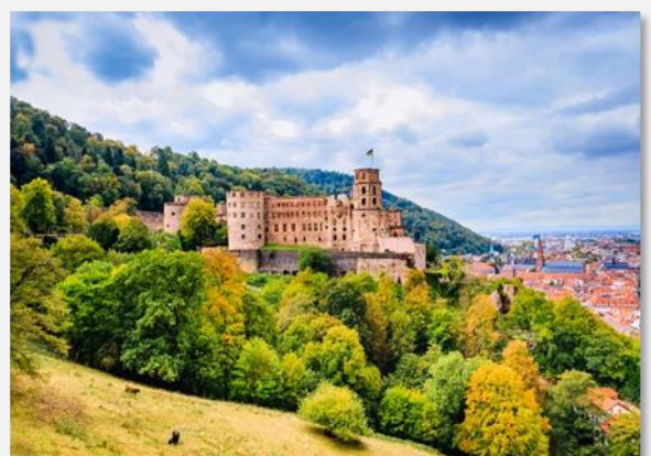
Το κάστρο της Χαϊδελβέργης