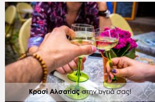
Κρασί Αλσατίας στην υγεία σας!