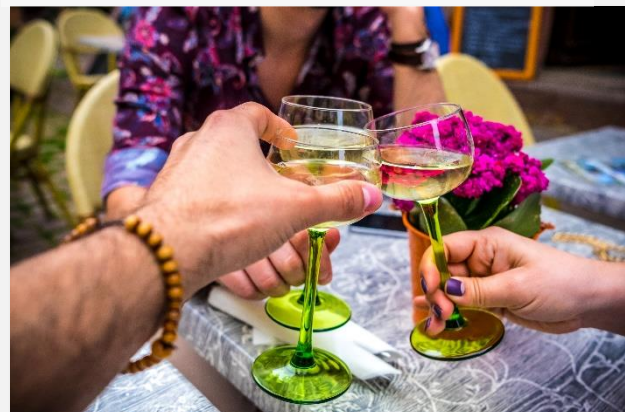
Κρασι Αλσατίας στην υγεία σας!