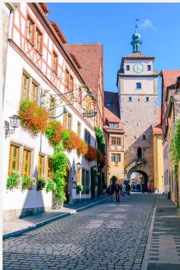
Ρότενμπουργκ ομπ ντερ Τάουμπερ

***Σημείωση: Κάποιες περιόδους, αναλόγως των καιρικών συνθηκών, ενδέχεται να είναι χαμηλή η στάθμη του νερού στο Ρήνο. Σε αυτή την περίπτωση, το δρομολόγιο της κρουαζιέρας τροποποιείται, κατόπιν οδηγιών από την εταιρεία που την πραγματοποιεί.