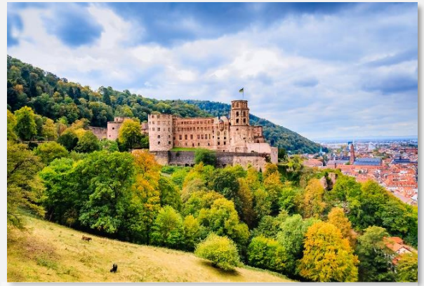
Το κάστρο της Χαϊδελβέργης

Σήμερα μετά το πρωινό μας στο ξενοδοχείο θα αναχωρήσουμε οδικώς για την περιοχή του διάσημου Μέλανα Δρυμού. Πρόκειται για τον σημαντικότερο πνεύμονα πρασίνου της Ευρώπης – ένα πυκνό καταπράσινο δάσος που εκτείνεται από τον Ρήνο ως τον Δούναβη. Η πρώτη στάση μας είναι το κοσμοπολίτικο Μπάντεν Μπάντεν , φημισμένο για τα ιαματικά λουτρά και το καζίνο του. Εδώ θα έχουμε χρόνο στη διάθεσή μας για έναν περίπατο, προκειμένου να πάρουμε μια γεύση από την αρχοντική αυτή πολιτεία που σαγήνευσε τσάρους, αυτοκράτορες και κάθε λογής γαλαζοαίματους της Γηραιάς Ηπείρου. Μετά το Μπάντεν Μπάντεν θα οδεύσουμε προς την πανέμορφη λίμνη Τιτι , δημιούργημα των παγετώνων και αγαπημένο θέρετρο των Γερμανών, που φτιάχνουν τα σαλέ τους ανάμεσα στις καταπράσινες ελατοσκέπαστες πλαγιές των γύρω λόφων. Η μέρα μας θα συνεχίσει με επίσκεψη στο Φράιμπουργκ , τη μεγαλύτερη πόλη στις παρυφές του Μέλανα Δρυμού και αγαπημένη του Νίκου Καζαντζάκη. Είναι χτισμένη στις όχθες του ποταμού Ντράιζαμ και θεωρείται η